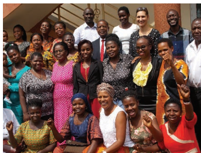
Des travailleurs à domicile planifiant le réseau.

Après les séances de sensibilisation, les leaders du groupe de femmes ont commencé à planifier la création d'un réseau en Ouganda.