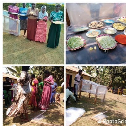
Le séchage solaire de fruits et de légumes.