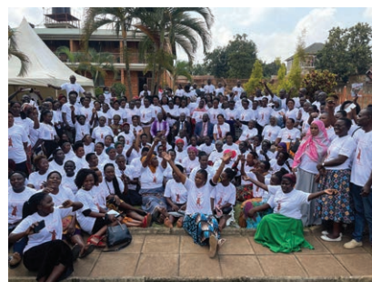
Premier atelier national de la NBO.

Le recrutement des membres s'est poursuivi entre avril et juillet 2022 sur le thème « Nous sommes des travailleuses ; nos foyers sont des lieux de travail ». Soutenu par WIEGO, la NBO a organisé son premier atelier national à Kampala du 5 au 7 février 2023. L'atelier a rassemblé des travailleuses à domicile de tout l'Ouganda, renforçant la solidarité et créant une compréhension commune des objectifs de la NBO.