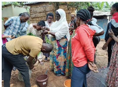
La culture d'épices.

et initiatives dans lesquelles ils sont impliqués, par exemple le séchage solaire des fruits et légumes pour prolonger leur durée de conservation et créer des débouchés au-delà des communautés locales.