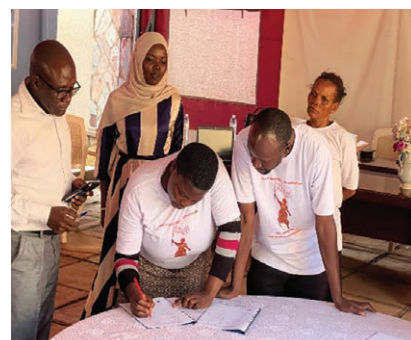
Les membres du comité exécutif de la NBO signent l'adhésion à l'ATGWU.