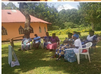
Exercices de recrutement et de sensibilisation au sein des communautés.

En 2020, malgré les défis posés par la pandémie de la covid 19, les membres ont maintenu le contact entre elles grâce aux plateformes virtuelles, telles que WhatsApp. Elles ont expliqué comment l'épidémie et le confinement les avaient affectées, ce qui a conduit à la rédaction d'une déclaration ouverte 4 adressée au gouvernement pour lui demander d'intervenir.