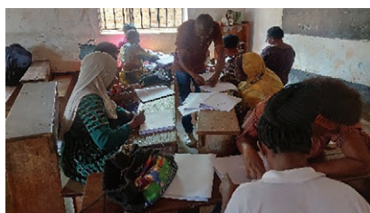
La production de livres scolaires.