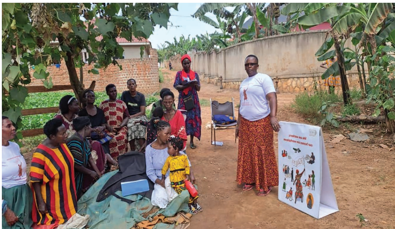
La rédaction des statuts dirigée par les membres.