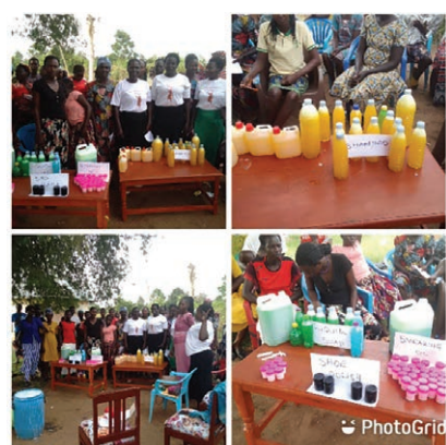
La production de savon liquide et de cirage pour chaussures

La formation des travailleurs a joué un rôle important dans la formation, le